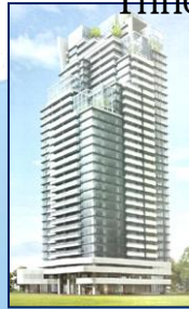
研發中心 台灣-台中市區 (第二研發中心)