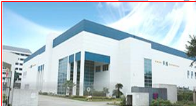
華國光學 中國-廣東佛山