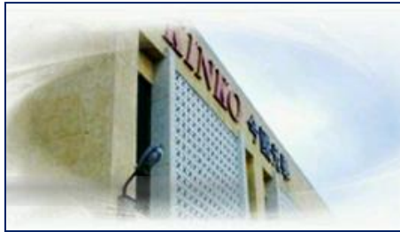
今國光學 台灣-台中(總部)

Innovate the way we live. Make the life better.