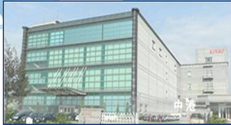
今國光學 台灣-台中(新廠)